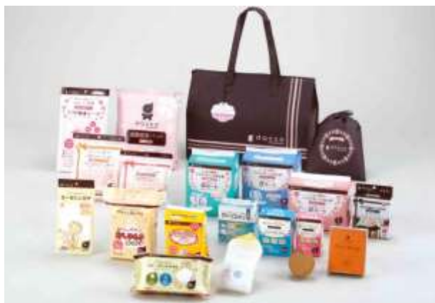
お産セット「dacco(ダッコ)」

クックパッドベビーは、妊娠・出産・育児のメディア事業と産婦人科向け事業を行っています。オオサキメディカルは、全国の産婦人科へ妊婦さんが利用するお産セット「dacco(ダッコ)」を提供し、国内では、圧倒的シェアを持っています。今回この業務提携により、「dacco(ダッコ)」にクックパッドベビーの持つ妊娠、出産、育児に関する付加価値の高い情報やノウハウを提供することで、妊婦さんや産後の女性により満足して利用してもらえることを目指していきます。