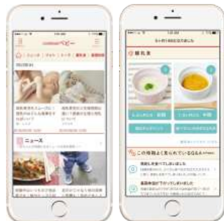
「クックパッドベビー」