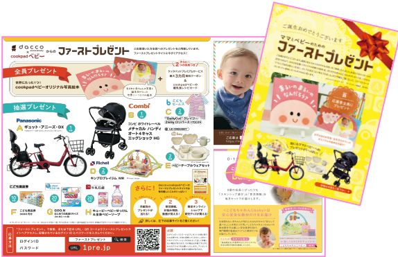
プレゼント告知「ファーストカード」

「ファーストプレゼント」のキャンペーン展開は、プレゼントキャンペーンを告知する「ファーストカード」を、オオサキメディカル提携の産院に販売するお産セット「dacco(ダッコ)」に同梱、配布いたします。ベビーを産んだばかりのママに、すぐに役立つプレゼントのキャンペーン告知を、最適なタイミングで展開してまいります。