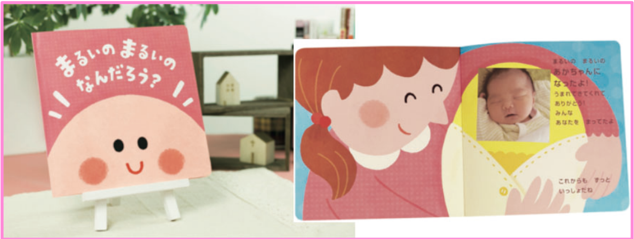
応募された方のベビーのお写真とお誕生日が入った、世界で1冊のオリジナル写真入り絵本

「ファーストプレゼント」は、ご出産を迎えたママに向けてのプレゼントキャンペーン。ベビーと始める新しい生活に役立つ豪華抽選プレゼントの他、クックパッドベビー企画による「オリジナル写真入り絵本」を応募者全員にお届け。ご応募いただいた方ご自身のベビーのお写真とお誕生日が入った、世界に1冊しかない絵本をプレゼントします。