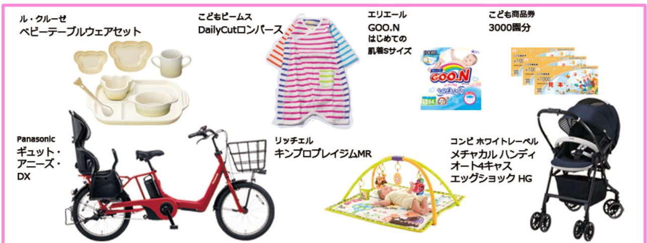
ベビーと始める新しい生活に役立つ、豪華プレゼントも多数ご用意