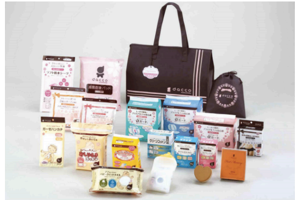
お産セット「dacco(ダッコ)」